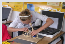
Kompetenzzentrum des Ilm-Kreises in Arnstadt.

Der Thüringer Berufswahlpass präsentiert sich mit seiner 7. Auflage zu Beginn des Schuljahres 2010/2011 in einem neuen Layout. Das aktuelle Verständnis von Berufsorientierung geht davon aus, dass sie mehr als die einmalige, lineare Berufswahlvorbereitung für eine Berufs- oder Studienwahlentscheidung ist. Sie ist als individueller Prozess zu verstehen, in dem die Kompetenz gefördert wird, Berufsbiografien zu entwerfen, vorzubereiten und zu gestalten.