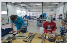
Projekt „Praxisorientierte Berufswahlvor- bereitung“ der Klassen 8a